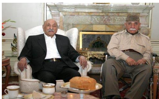
سردار ولی با شاه سابق

وی همچنان از سوی رئیس جمهور کرزی رتبه سترجنرالی را دریافت کرد و به مدال عالی دولتی هیواد مفتخر شد.