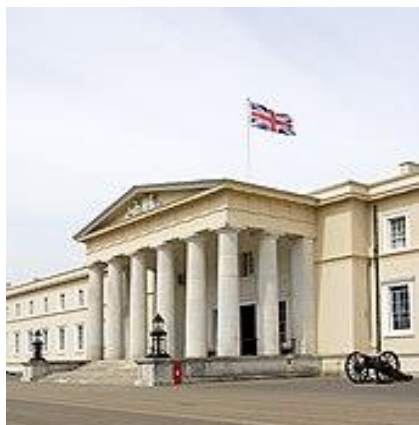
آکادمی سلطنتی آموزش های نظامی سندهرست

در این اکادمی شاگردان در یک پروگرام فشرده برای ۴۴ هفته مهارت های عملی و تئوریک نظامی را فرا می گیرند و با ارزش های اردوی بریتانیا آشنا می شوند. از بین شاهان و امیران در جهان