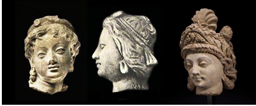
پیکره های زنان عهدکوشانی (معبد هده ، جلال آباد، قرن دوم میلادی)

باید اضافه کرد اکثر زنانیکه در این فصل معرفی گردید شخصیت های واقعی استند و برخی هم شخصیت های افسانوی واسطوره ئی که در هردو صورت اهمیت زنان و نقش سازنده شانرا در جامعه قدیم افغانستان گواهی میدهد.