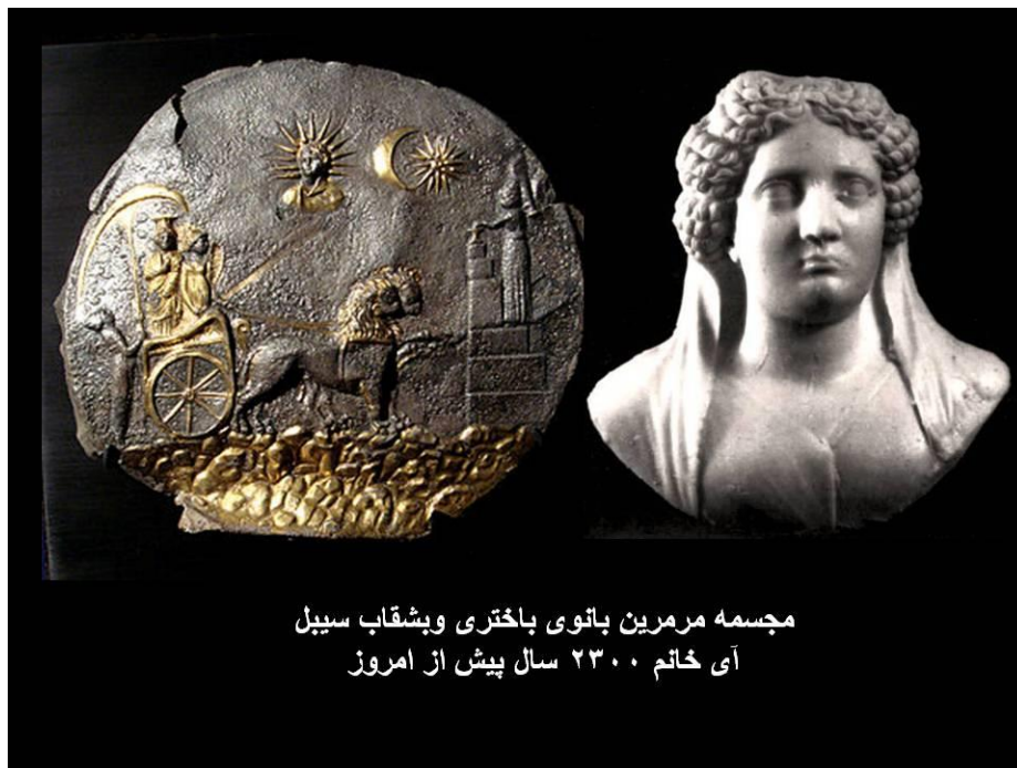
مجسمه مرمرین بانوی باختری وبشقاب سیبل آی خاتم ۲۳۰۰ سال پیش از امروز

بجا مانده آثار مدنیت بسیار پیشرفته ای در اثر کاوشهای باستان شناسی بدست آمده است. در میان آثار زیادیکه از آی خانم کشف شده بشقاب نقره ئی مزین با طلاکاری که بنام بشقاب سیبل Cybele یاد میشود اهمیت زنان آن دوره را به نمایش میگذارد. سیبل تلفظ یونانی این الهه باستانی است که در ممالک شرقی بنام MATAR KUBILEYA «مادر کابلیا» یاد میشود.