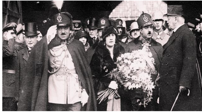
شاه امان الله و ملکه ثریا در سفر اروپا

چون او با متانت و چهره بشاش دشوارترین سوال های خبرنگار فرانسوی را پاسخ داد. همان بود که نماینده مجله هلو در پاریس در وصف ملکه افغانستان چنین نوشت: "من با ملکه ها و زنان درجه اول مقامات رسمی کشورها مصاحبه های زیادی داشته ام ولی کمتر زنی را به متانت و تیزهوشی ملکه افغانستان دیده ام. از این مصاحبه برایم یقین حاصل شد که محیط افغانستان میتواند هم دوش ممالک مترقی دنیا باشد و پیشرفت نماید." از زمره کارهای عمده ملکه ثریا افتتاح منار علم و جهل در دهمزنگ کابل است .