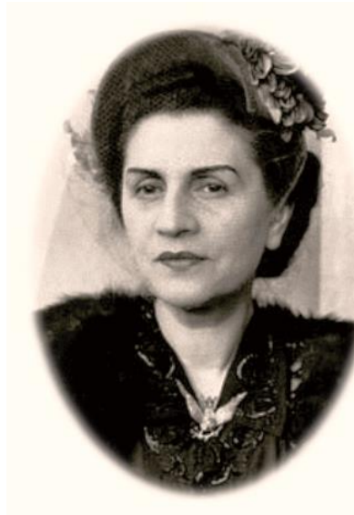
ملکه ثریا بانی نهضت زنان افغانستان

محمود طرزی که در ماه های اخیر زندگی سید جمال الدین افغان در ترکیه با افکار او آشنا گردیده بود به انکشاف معارف برای رهایی از استعمار و عقب مانده گی عقیده راسخ داشت و همسر و دختر فرزانه اش با او همنا بودند.