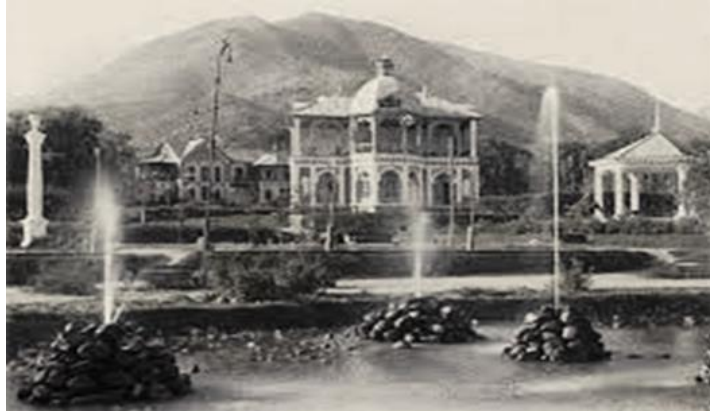
گوشه ای از باغ عمومی پغمان در عهد امانی

لیکن متأسفانه این اقدامات برای جامعه عنعنوی آن زمان پیش از وقت بود و باعث اغتشاش در کشور و سقوط دولت ترقیخواه امانی شد، اما خاطرات شاه امان الله و ملکه ثریا تا هنوز در نزد ملت افغانستان ارزشمند است و آن خدماتی را که انجام دادند و پایه گذاری کردند تا هنور رهگشای جامعه مدنی، اهل معارف و بخصوص زنان با فرهنگ افغانستان است.