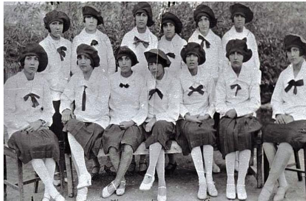
اولین دسته از دختران افغان که به غرض تحصیل عازم ترکیه شدند.

هرچند دوره نهضت امانی بعد از ده سال تلاش در راه تأمین حقوق مدنی بشمول به رسمیت شناختن حقوق زنان در سال ۱۹۲۹ به پایان رسید، اما آن اساسات در سالهای ما بعدی در حافظه جامعه بجا ماند و رهنمایی برای نسل های آینده، بخصوص زنان افغانستان گردید. از سوی دیگر، گرچه عده ای اقدامات عجولانه امان الله خان و ملکه ثریا را در تغییر جامعه سنتی افغانستان پیش از وقت میپندارند، اما اساسی را که این دوشیزگان شجاع و پیش آهنگ در پیشرفت و ترقی کشور بنا نهادند تا امروز اثرگذار است.