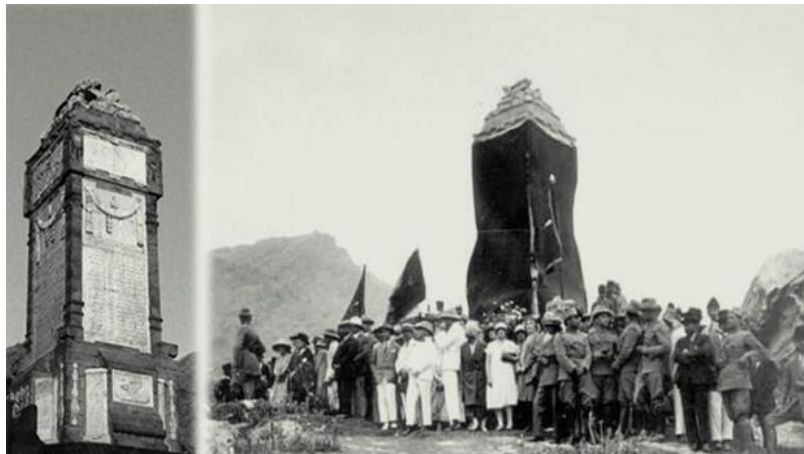
تصویر تاریخی ملکه ثریا در روز افتتاح رسمی «منار علم و جهل»

چون او با متانت و چهره بشاش دشوارترین سوال های خبرنگار فرانسوی را پاسخ داد. همان بود که نماینده مجله هلو در پاریس در وصف ملکه افغانستان چنین نوشت: "من با ملکه ها و زنان درجه اول مقامات رسمی کشورها مصاحبه های زیادی داشته ام ولی کمتر زنی را به متانت و تیزهوشی ملکه افغانستان دیده ام. از این مصاحبه برایم یقین حاصل شد که محیط افغانستان میتواند هم دوش ممالک مترقی دنیا باشد و پیشرفت نماید." از زمره کارهای عمده ملکه ثریا افتتاح منار علم و جهل در دهمزنگ کابل است .