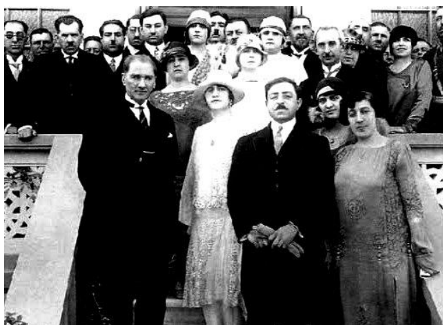
شاه امان الله و ملکه ثریا با انا ترک در هنگام دیدار محصلین افغان در ترکیه

" امروز یک روز نهایت خوب است که اولاد وطن از این مکتب مستفید شده و در راه دین- دولت و ملت خویش حتی الوسع خدمت کنند. به همه حاضرین معلوم است که فرضیت علم به مرد وزن یکسان است و این مکتب از توجهات معارف خواهی اعلیحضرت جوان غازی امان الله خان برای ما زنان تأسیس شده که در این مورد همت و کوشش جناب وزیر معارف را بدیده تقدیر می نگرم. پس بر ما زنان است تا در راه علم و معارف بکوشیم."