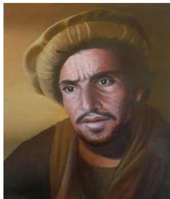
دو اعجوبه خيانت و نفرت