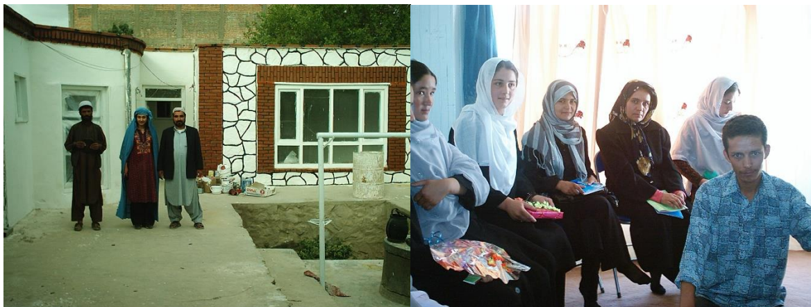
پیشرفت امور ساختمانی مرکز تعلیمی غزنی

این مرکز آموزشی که در مرکز غزنی در قلب بازار کهنه شهر غزنی موقعیت دارد و روزانه در حدود زیادتیر از ۶۰ خانم را پذیرا می باشد. آنهای که از نعمت تعلیم بهره مند اند، در این مرکز به یاد گرفتن انگلیسی و انفارماتیک و خانم های که سواد ندارند کورس های سواد آموزی، و قرار انتخاب خود شان کورس های گل دوزی، زراعت و مالداري، تولید سبزیجات و قوریه جات و برخی هم به کمک های اولیه صحی مشغول آموزش اند.