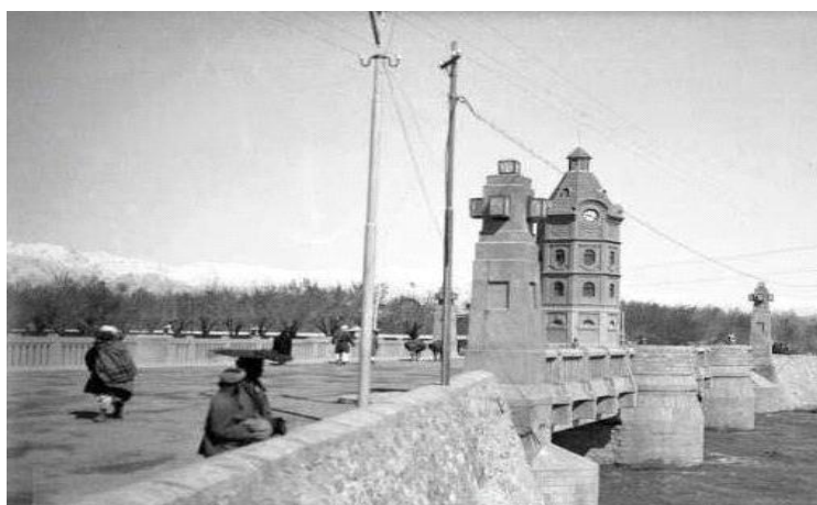
پُل محمود خان

در مقابل پُل محمود خان یک برج ساعت که در زمان امیر حبیب الله خان [سراج الملت و الدین] ساخته شده بود، وجود داشت که در زمان جنگ های داخلی در سالهای 1992 الی 1996 میلادی مطابق به دهه 1370 هجری قمری این پُل ویران و برج ساعت تخریب شد.