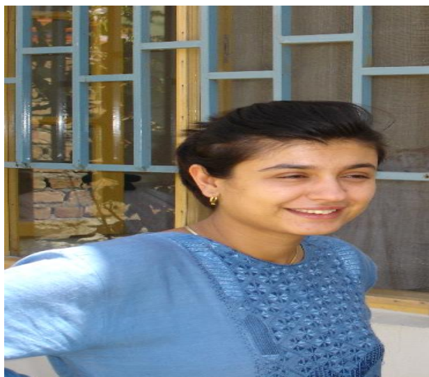
مرجان در کابل

ای روی تو مهر انور من وی مهر تو نقش گوهر من ای یاد تو نقش عالم جان ای نام تو زیب و زیور من روزی که زبون و زار بودم بودی تو یگانه باور من در ورطه بی سخت زندگانی افکار تو بود رهبر من پیوسته چو مهر می درخشید تصویر تو در برابر من زیرا که تویی، تو جان مادر یکتای زمانه دختر من