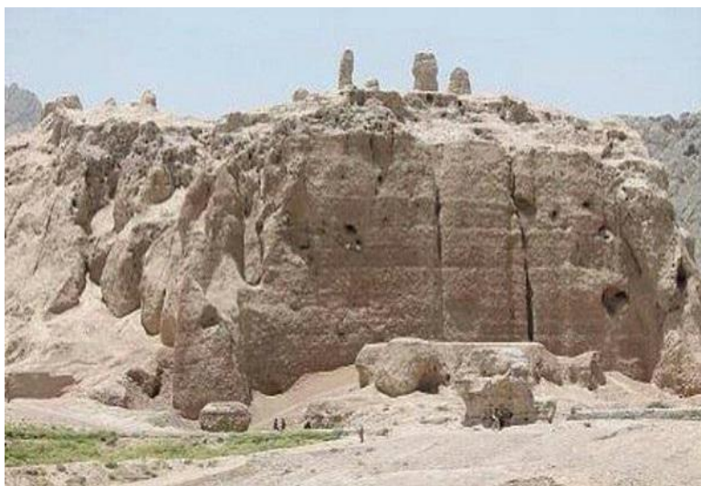
قلعه احمد شاهی

ولسوالی های قندهار: شهر قندهار، دامان، ارغنداب، ارغستان، پنجوایی، ریگستان، معروف، سپین بولدک، میوند، تخته پل، ریگستان.....می باشد. باشندگان قندهار را اقوام پشتون، بلوچ، تاجک، هزاره و هندو تشکیل داده است.