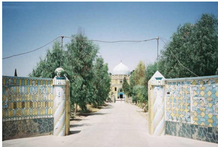
آرامگاه میرویس هوتک

شهر تاریخی قندهار قدامت 3000 سال قبل از مسیح دارد، و اکثراً نظر به موقعیت ستراتیژیکی خود مورد اشغال و تاخت و تاز قرار گرفته است. در دوره مادها و هخامنشیها یک سرزمینی به نام مندوگک، که در اطراف دریای ارغنداب قرار داشت، بعد از آن که اسکندر مقدونی هرات را تصرف کرد به طرف قندهار رفت، این سرزمین اطراف دریای مرغاب توسط اسکندر مقدونی اشغال، و نام آن را اسکندریه گذاشت، که همین قندهار امروزی می باشد. بعد از وی این شهر تحت کنترل کوشانیها درآمد، و توسط آشوکا دین بودایی وارد قندهار شد. در قرن هفتم میلادی قندهار مورد حمله اعراب قرار گرفت و شهر به دست عربها افتاد. بعداً در قرن دهم به دست غزنویها افتاد و در قرن سیزدهم به اشغال چنگیز، و در 1383 میلادی به دست تیمور افتاد. شهر قندهار دو مراتبه ویران گردید مرتبه اول توسط مغلها و بار دوم توسط تیمور ویران شد. در قرن چهاردهم بابر بنیان گذار امپراطوری مغل، قندهار را با هند یکجا نمود، بعد از بابر پسرش همایون قندهار را از دست داد، پسر همایون، اکبر دوباره قندهار را به دست آورد. تا این که در سنه 1709 میلادی میرویس هوتک از قبیله غلزایی پشتون به اشغال قندهار خاتمه داده و دولت مستقل را تأسیس کرد.