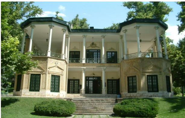
بنا ای احمد شاهی

احمد شاه ابدالی در سنه 1754 شهر کنونی قندهار را ساخته و نامش را اشرف البلاد گذاشت، بعداً پسرش تیمور شاه پایتخت را به کابل انتقال داد.