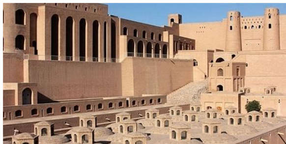
ارگ یا بالاحصار هرات

دوباره صدمات زیاد دید، و در سال 2007 میلادی به کمک اضلاع متحده امریکا دوباره باز سازی گردیده و به موزیم تبدیل گردید.