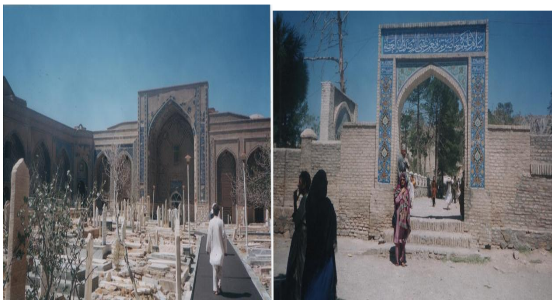
آرامگاه خواجه عبدالله انصاری

از جمله نوابغ و علمای مشهور هرات، عصر سلجوقیان بوده که در طوس در سال 1006 میلادی یا قرن یازدهم میلادی متولد و در سنه 1089 میلادی از این جهان فانی رحلت نمود. وی از جمله بزرگترین عالمان فقه (Théologien)، بزرگترین شاعر، ادیب، صوفی و عارف و دانا بود و در علم تصوف به بلندترین مقام رسید، که مناجات های او بسیار مشهور می باشند، مولانا به لقب شیخ الاسلام مشرف گردیده بود. مزار خواجه عبدالله انصاری پیر هرات، عارف برجسته و شاعر نامدار در شمال شهر هرات واقع است.