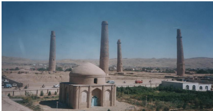
منار ها و آرامگاه ملکه گوهرشاد

آثار تاریخی هرات: بالاحصار یا قلعه یا ارگ هرات، منار های هرات، مسجد جامع هرات، آرامگاه خواجه عبدالله انصاری و آرامگاه ملکه گوهر شاد خانم ادیب و دانشمند، همسر شاه رخ میرزا، که در عصر با شکوه تیموریان در قرن پانزدهم میلادی (1469-1506) می زیست. از شعرا، ادیبان و رسامان این دوره میتوان از شاعر و عارف جامی، امیر علی شیر نواعی و رسام بزرگ میناتوری بهزاد نام برد.