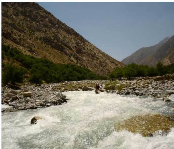
مناظر جلال آباد

از نگاه علم و فرهنگ: ولایت ننگرهار از نقطه نظر علمی و فرهنگی از جمله مهم ترین ولایات افغانستان به شمار می رود، به طور نمونه از چند مشاهیر مشهورمانند: مهمند، ریشترین، خادم، موسی شفیق، آخوند بتی کوت، کشکی، عبدالرحمن پژواک، خوگیانی..... می توان نام برد.