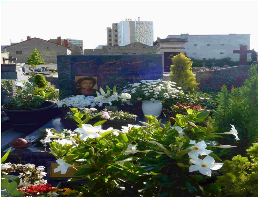
گلچین روزگار عجب خوش سلیقه است می چیند آن گلی که به عالم نمونه است