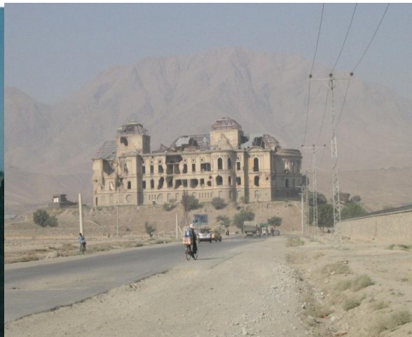
قصر دارالامان بعد از جنگ ها

از جمله آبدات این دوره میتوان از باغ عمومی پغمان، طاق ظفر پغمان، قصر دارالامان، شفاخانه زنانه مستورات و تأسیس اداره باستان شناسی نام برد.