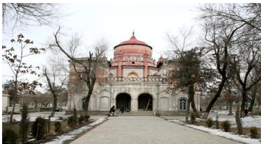
آرامگاه امیر عبدالرحمن خان

در قسمت پارک زرنگار امروزی امیر عبدالرحمن خان قصری دیگری اعمار نمود که مزارش می باشد.