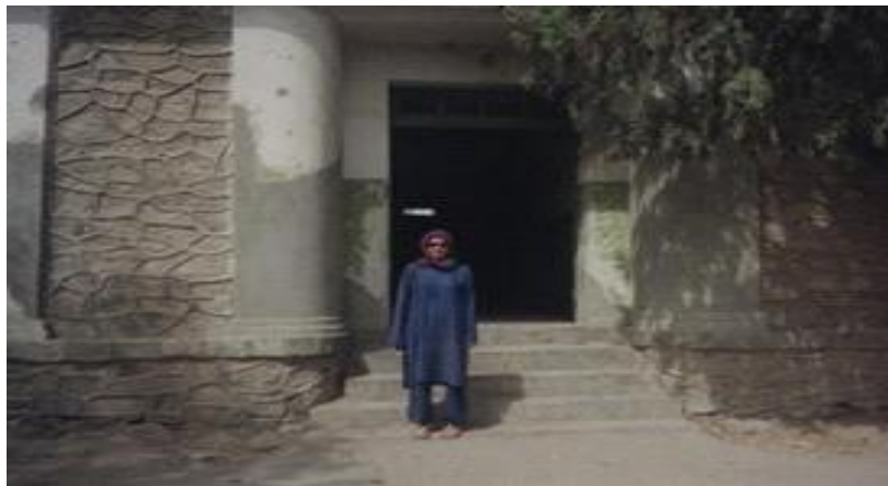
مرجان در مقابل شفاخانه علی آباد

از جمله آبدات این دوره میتوان از باغ عمومی پغمان، طاق ظفر پغمان، قصر دارالامان، شفاخانه زنانه مستورات و تأسیس اداره باستان شناسی نام برد.