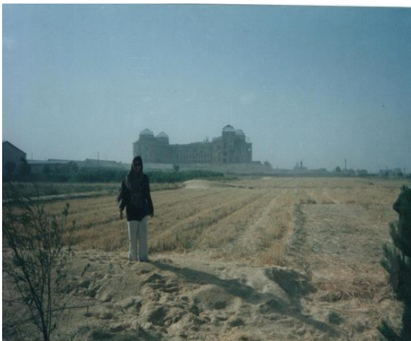
مرجان در دارالامان

در عصر امانی پیش رفت های زیادی در امور عمرانی، فرهنگی، معارف، تجارت، ساختن باغ های تفریحی، نشرات رادیو، اولین سینما در کابل، عکاسی، اخبار و مجلات صورت گرفت.