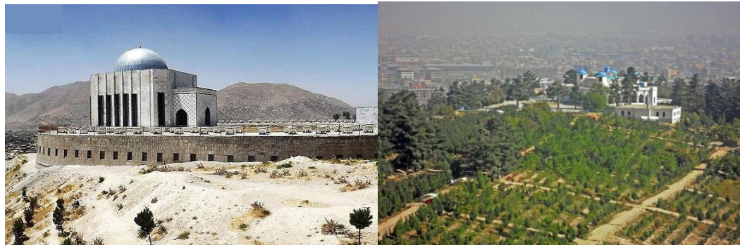
طرف راست تپه مرنجان ، طرف چپ تپه باغ بالا