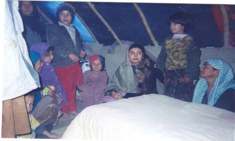
مرجان در کابل زمستان 2004 میلادی

در خانه هر کجا نگرم خاطرات توست هر کنج خانه از تو ببینم نشانه ها