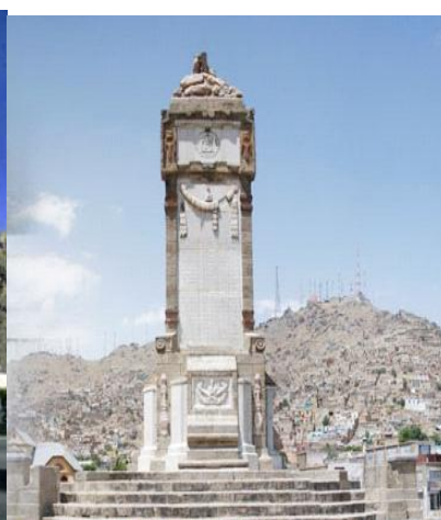
منار علم و جهل