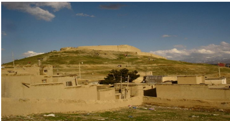
تپه کلوله پشته

تپه مرنجان: یکی از ساحات باستانی کابل بوده و حفریاتی باستان شناسان در این جا، مربوط به دوره کوشانی ها می باشد. که در این عصر از معابد بودایی مجسمه ها، ظروف گلی و مسکوکات بدست آمده است، مسکوکات مسی و طلائی بوده اند.