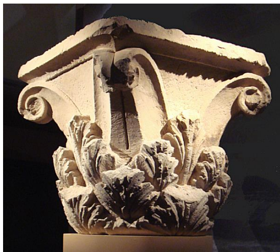
سر ستونی زیبای کروننتین آی خانم