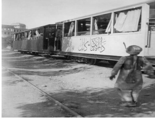
تصویری از خط ریل بین مرکز شهر کابل و دارالامان - از نوآوری های عصر امانیه

مشاهده میگردد که با موجودیت شاه جوان و ترقی خواه، چگونه در پهلوی تعمیر این بنای باشکوه اولاد معارف در کمال دقت و توجه برای آینده خود و مملکت در امور مهندسی و تعمیرات تربیه عملی و نظری میگردیدند که بدون شک از نقطه نظر کیفیت استخدام و آموزش اصول جدید تعمیرات کمک بزرگی محسوب میگردید.