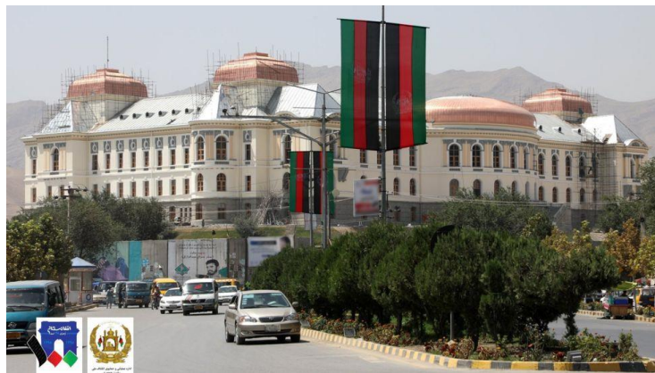
عکس جدیدی از پروژه تعمیر و ترمیمات اخیر نزدیک به اتمام قصر دارالامان

ویرانه های این قصر باشکوه تاریخی که اگر دیوار های آن صدا میداشتند و حوادث و حکایات زیادی را بیان مینمودند، آنقدر غم انگیز میبودند که تأثر و تأسف هر بیننده و هموطنی را تحریک مینمود.