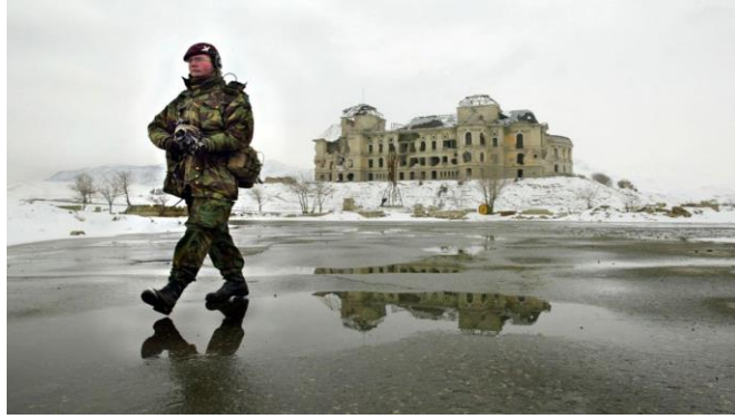
قصر دارالامان بعد از تخریب در عصر تنظیم ها، سالهای زیاد چنین باقی ماند - عسکر ناتو

بعد از آغاز دوره جدید یعنی عصر نادر شاهی، قصر دارالامان که علاقمندی برای استعمال اسم آن موجود هم نبود، برای امور مختلفه اداری مورد استفاده قرار گرفت؛ طوریکه در عصر سلطنت محمد نادر خان پوهنخی طب و لیلیه آن در آنجا قرار داشت و قسمتی از اطاق های فراوان آن برای ذخیره گدام کشمش استفاده شد.