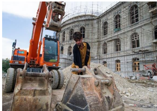
قصر دارالامان حین ترمیمات و اعمار درین سالهای اخیر

در عصر اعلیحضرت محمد ظاهر شاه و صدارت سردار محمد داوود، از قصر دارالامان برای وزارت های فواید عامه و وزارت مالیه استفاده به عمل آمد، که بعد تر وزارت مالیه به تعمیر جدیدی نقل نمود ولی قبل از آن در سال ۱۳۴۷ - ۱۹۶۸ حریق بزرگی در قصر صورت گرفت که خسارات بسیاری بار آورد، چنانچه سیستم آبرسانی، مرکز گرمی، تشکیلات برق و تزئینات هنرمندانه و زیبای قصر مخصوصاً در طبقه سوم ویران شده و صدمه زیادی دید.