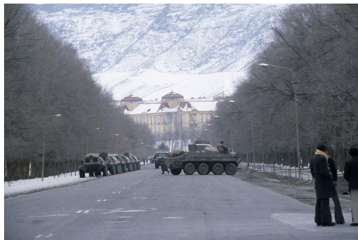
تصویری از قصر دارالامان در عصر اشغال افغانستان ذریعه قوای سرخ اتحاد شوروی

کار و تعمیر قصر باشکوه دارالامان با ساحه ۵۴۰۰ متر مربع بصورت سه طبقه با جد و جهد معماران لایق افغان و تیم ماهر مهندسان آلمانی تا سال ۱۳۰۶ هـ ش - ۱۹۲۷ تقریباً به پایه تکمیل رسید؛ در حالیکه تا اخیر دوره امانیه ۱۹۲۹ هنوز هم قسمت هایی باید بسر می رسید.