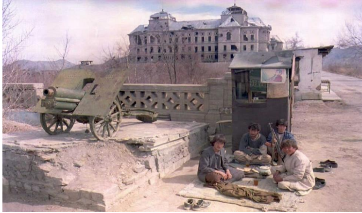
نمایی غم انگیز از ویرانه قصر دارالامان در عصر تبادلۀ راکت و آتش مسعود - گلبدین

در زمره تعمیرات جدید یکی قوماندانی قوای مرکز در تپه تاج بیگ و دیگری ساختمان پل آرتن بود. البته برای سهولت رفت و آمد سرک بزرگ دارالامان تا مسجد شاه دوشمیره هم با مهندسی آلمان ها بصورت اساسی طرح و تعمیر گردید. حتی موزیم کابل و پوسته خانه مرکزی همچنان از یادگار های همان عصر مترقی میباشد که سال های سال به خاطر دقت و توجه در ساختمان آنان، بصورت پایدار دوام نمودند.