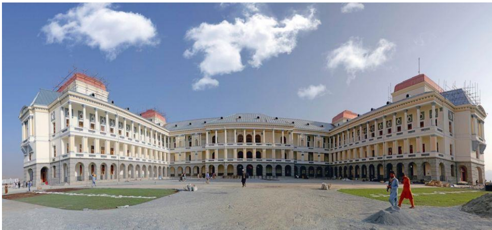
تصویر زیبایی از منظره عقب قصر دارالامان بعد از اتمام ترمیمات و اعمار مجدد آن

اعمار آن چه پلان های عام المنفعه و چه آموزش و مطالعاتی بوجود آمد، طوریکه در چنان عصری عده زیادی از معماران، مهندسان، هنرمندان و اهل کسبه را در پهلوی شاگردان به کار و آموزش گماشت.