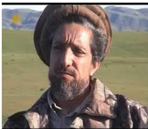
چهره یک تبهکار و ضد میهن

زمانیکه جنبش میهنی ضد تجاوزگران شوروی و عمال آنها به رهبری خردمندانه پهلوان احمد جان در پنجشیر اوج میگرفت، احمد شاه مسعود هنوز هم در پاکستان بود و از آی اس آی فرمان میبرد.