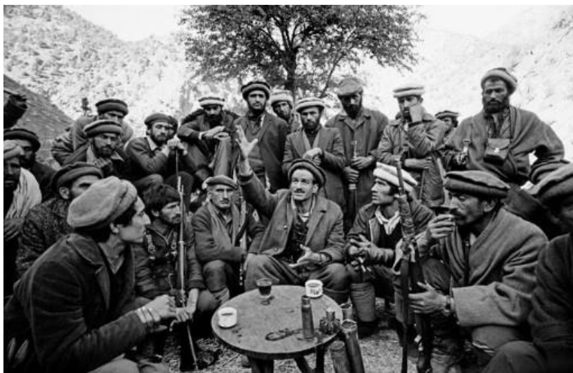
درین تصویر، پهلوان احمد جان دستور میدهد و احمد شاه مسعود فرمان میبرد.

قال عده ای از راه گم گشتگان به نفع مزدوران استعمار، هرگز نمی تواند هویت واقعی و ضد میهنی عمال استعمار را که جنایات عظیم در حق ملت افغان روا داشته اند، بیوشاند. کشتار هائی که احمد شاه مسعود در کنج و کنار افغانستان به شمول کابل و دره پنجشیر مرتکب شد، غیر قابل بیان است. یکی از قربانیان جنایات ضد بشری احمد شاه مسعود، شهادت بزرگ مرد، پهلوان احمد جان بود که در شهامت و سرسپردگی به ارزش های میهنی از افراد کم نظیر کشور محسوب میشد که از کلیه تعصبات قومی، مذهبی و سمتی نفرت داشت. مردم پنجشیر و مبارزان راه آزادی این بخشی از وطن، پهلوان احمد جان را نماد مقاومت میهنی علیه متجاوزین شوروی و عمال مسکو می دانستند. موجودیت همچو شخصیت برجسته می توانست مسیر سیاسی و اجتماعی کشور را به نحو مثبت تغییر دهد و از بربادی های تحمیلی احمد شاه مسعود بر خاک و میهن ما جلوگیری نماید.